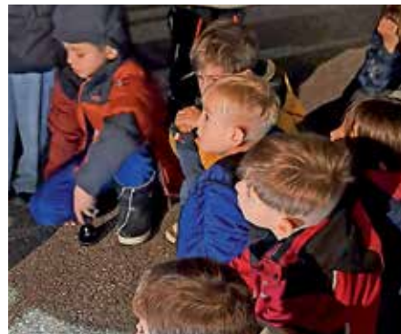
Alle lauschen gespannt an der Vorlesestation bei der Nachtwanderung durch die Reben

Sind wir doch mal ehrlich: viele Eltern kennen es. Die Kinder verbringen mittlerweile nicht nur Zeit beim Spielen mit Freunden, sondern elektronische Geräte halten vermehrt Einzug im Alltag. Sei es durch Lernapps, durch das Schauen von Serien oder durch Spiele. Jedes Kind kennt Handy, Ipad und Co.