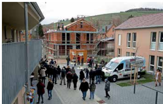
Richtfest in Niederweiler: Das Kopfgebäude der inklusiven Wohnanlage der Christophorusgemeinschaft nimmt Gestalt an