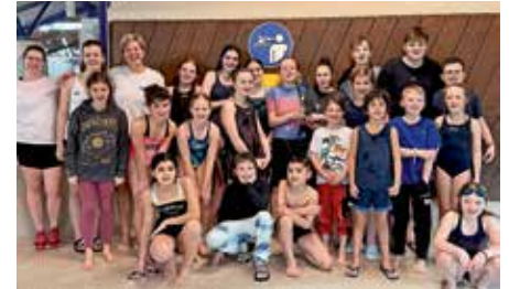
Team SG Badenweiler-Neuenburg

Am 16. März wurden erneut die Wintermeisterschaften des Sportkreises Breisgau-Hochschwarzwald im Gundelfinger Obermattenbad ausgetragen. Knapp 130 Aktive waren gemeldet, darunter auch die Schwimmer und Schwimmerinnen der SG Badenweiler-Neuenburg. Besonders für Nachwuchstalente stellt diese Veranstaltung einen wichtigen Einstieg in den Wettkampfbetrieb dar.